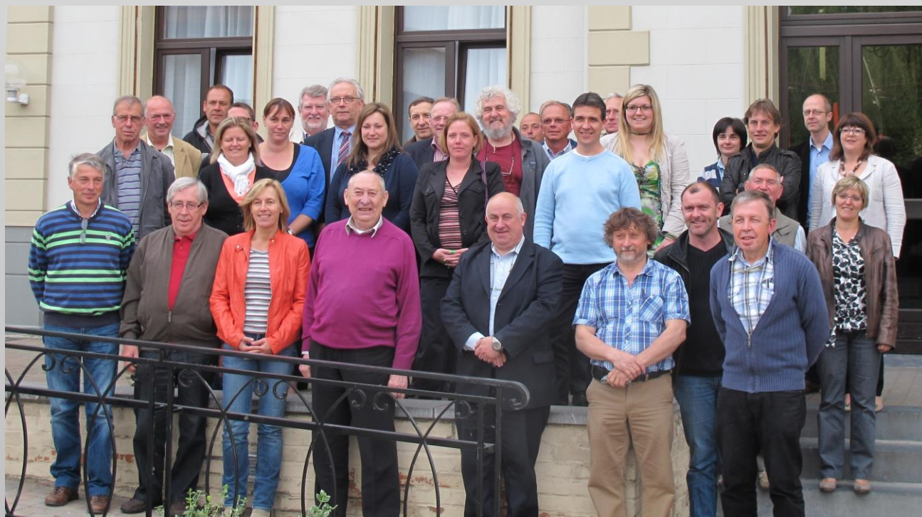
La Commission Locale de Développement Rural de Hannut : le moteur de l'ODR de Hannut

La CLDR vote un Règlement d'Ordre Intérieur (ROI).